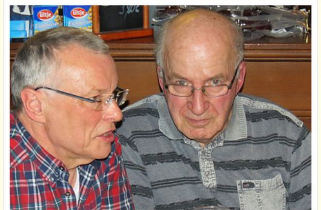
Musikanten-Stammtisch, Endingen 2016