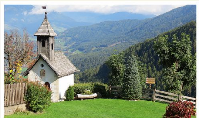
Harmonika-Seminar, Südtirol 2015