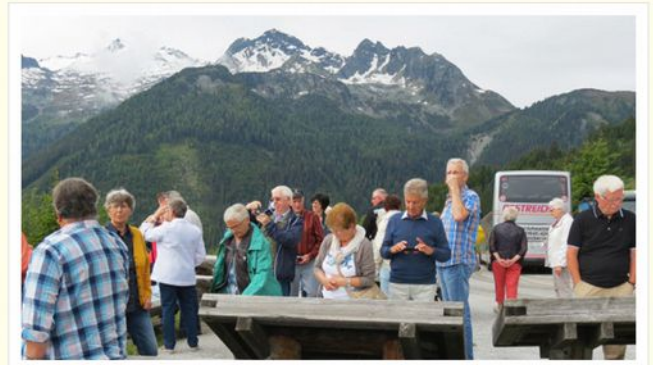
Busreise ins Zillertal