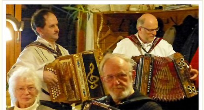
Musikantenstammtisch in der Holzfällerstube