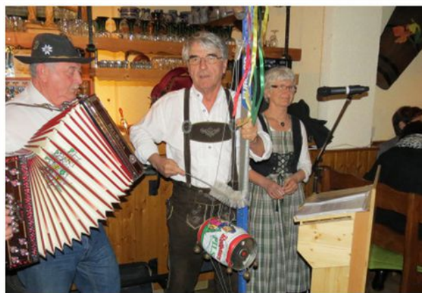
Steirischer Abend, Glottertal 2016