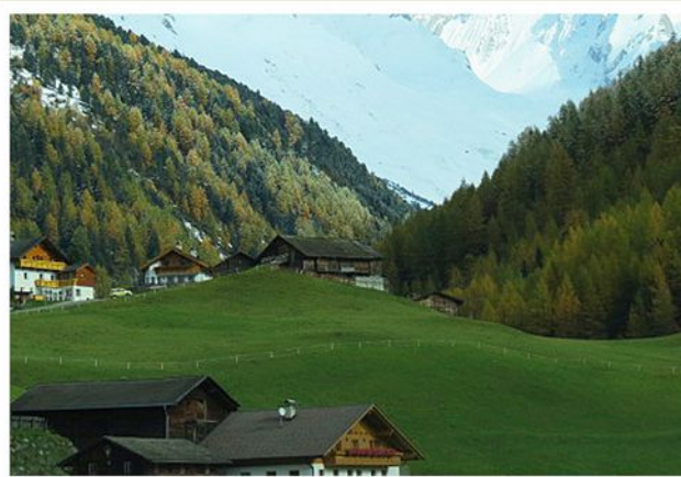
Harmonika-Seminar, Südtirol 2015