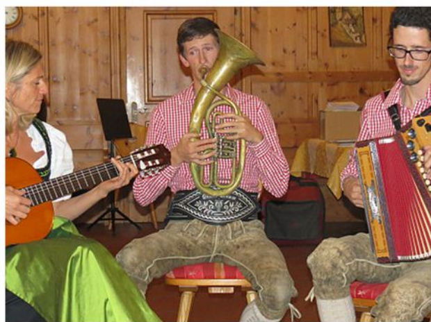
Harmonika-Seminar in Südtirol