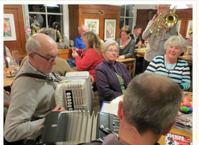
Musikanten-Stammtisch, Endingen 2016

09. September ab 18 Uhr Musikantenstammtisch "Wer kann der darf" Gäste herzlich willkommen! Endingen Gasthaus Schützen Tel. 0 76 42 / 80 69 09. September ab 19 Uhr Edeltrauds Singabend mit wechselnder musikalischer Begleitung St. Märgen Hotel Löwen Tel. 0 76 69 / 376 17. September ab 19 Uhr Steirischer Abend Glottertal Haberstroh Vesperstube Tel. 0 76 84 / 316