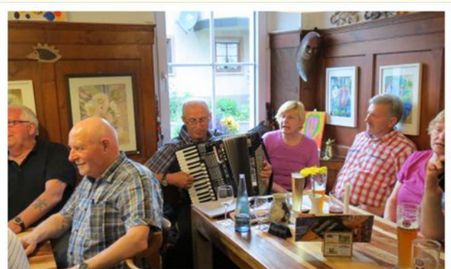
Musikanten-Stammtisch im Gasthaus Schützen, Endingen