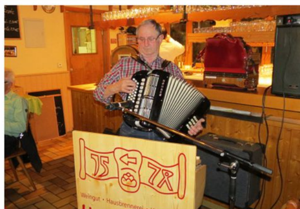
Steirischer Abend, Glottertal 2016