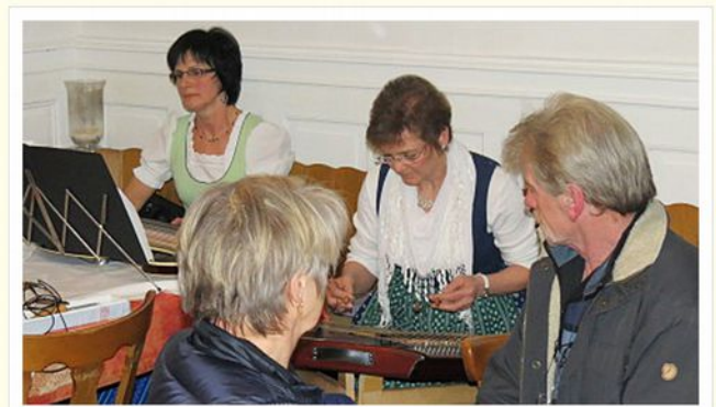
Musikanten-Stammtisch, Endingen 2016