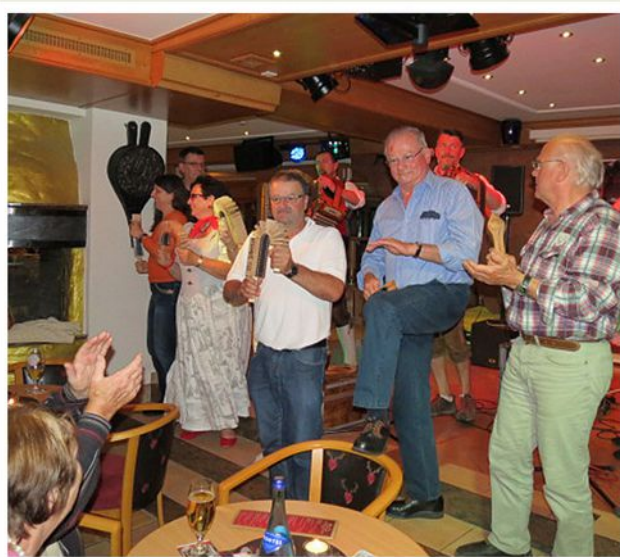
Busreise ins Zillertal