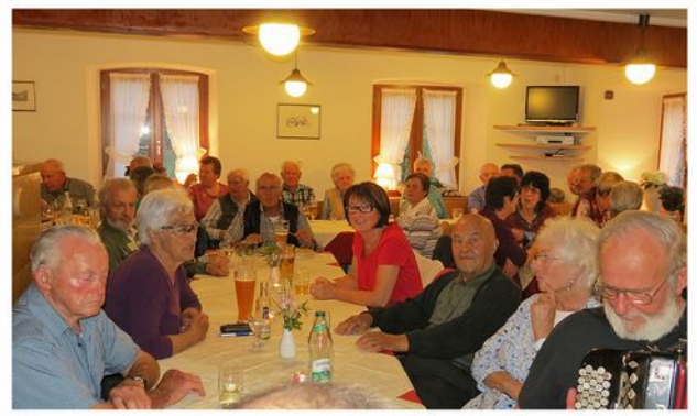
Musikanten-Stammtisch, Säglplatz 2015