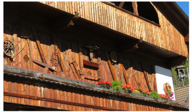
Harmonika-Seminar, Südtirol 2015