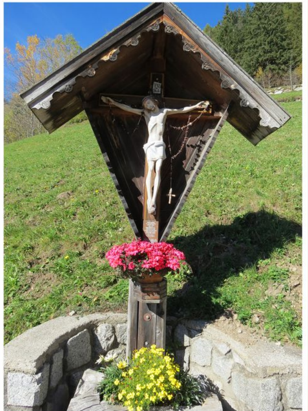
Harmonika-Seminar, Südtirol 2015

Öffnungszeiten: Montag bis Freitag von 6.00 bis 18.00 Uhr Samstag von 6.00 bis 17.00 Uhr auch Sonntags von 7.30 bis 17.00 Uhr