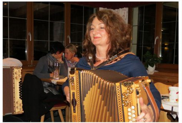
Harmonika-Seminar, Südtirol 2015