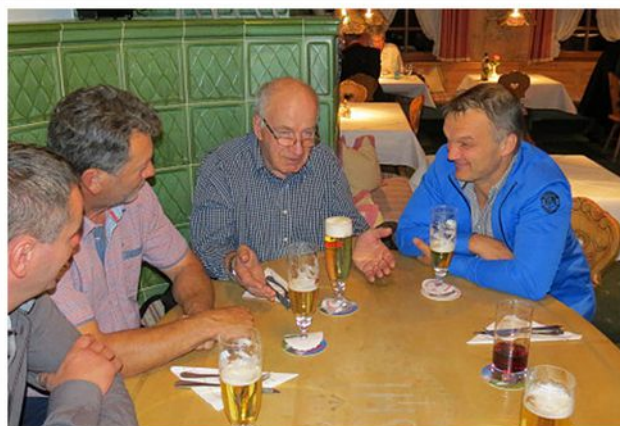
Harmonika-Seminar, Südtirol 2015